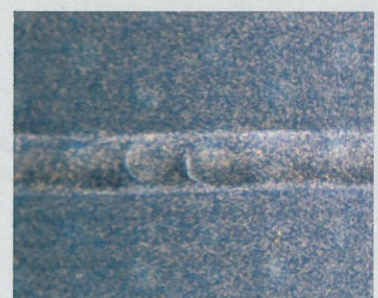
Abriebfeste Spezialbeschichtung TACMASTER BLUE